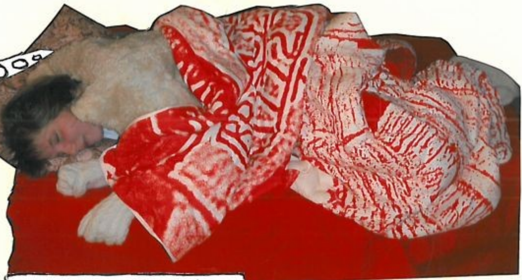
Wilma träumt von ihrem schönen, weichen Fell.